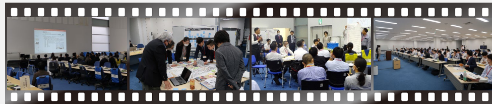
令和5年度 第2期 演習風景 (講義・グループワーク)